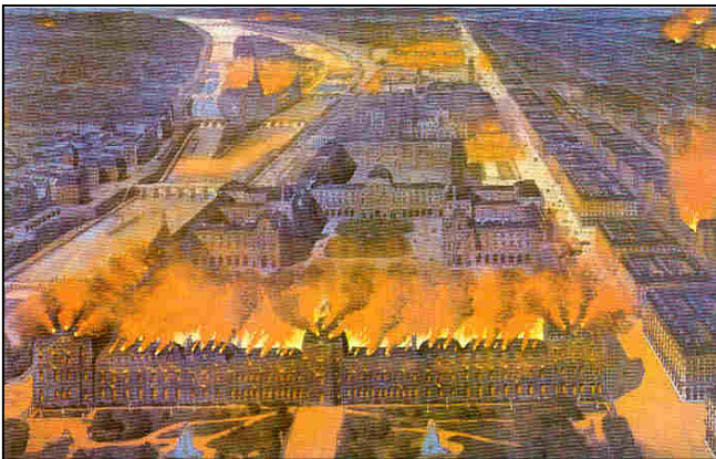
Incendio de París durante los sucesos de la Comuna, primera revolución obrera que triunfó.

Se desarrolla en la segunda mitad del XIX y es una alternativa distinta del marxismo. Sus principales teóricos fueron : Proudhom, Bakunin y Kropotkin. Aunque no tienen una ideología tan definida como los socialistas y dentro de ellos hay muchas variantes ideológicas distinguiremos varios principios :