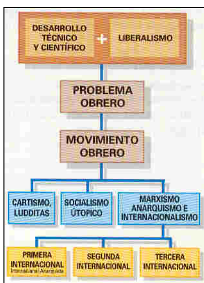
Los principales movimientos obreros y sus raíces.