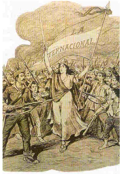
Ilustración de la Internacional de trabajadores.

Fue la primera vez que triunfó una revolución obrera. Se dio en París cuando tras la caída de Napoleón III las elecciones de 1871 dieron el poder a los conservadores. Los obreros se sublevaron y en París se produjo una verdadera guerra civil. Los trabajadores de todas las tendencias políticas y sociales se hicieron con el control de la ciudad, de las fábricas y talleres organizando París según los principios revolucionarios. El Gobierno recurrió al ejército y los obreros fueron duramente reprimidos, pero los obreros y burgueses comprobaron de qué eran capaces los trabajadores, esto serviría de estímulo a movimientos posteriores. La burguesía cogería miedo a estos movimientos y para contrarrestarlos intentaría mejorar algo las condiciones de los trabajadores.